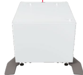
4. MX-DS22N Unterschrank