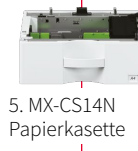
5. MX-CS14N Papierkassette