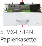
5. MX-CS14N Papierkassette